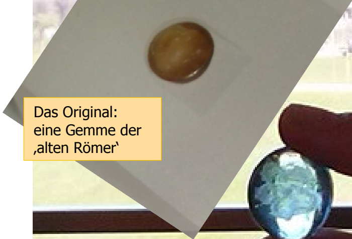
Das Original: eine Gemme der 'alten Römer'