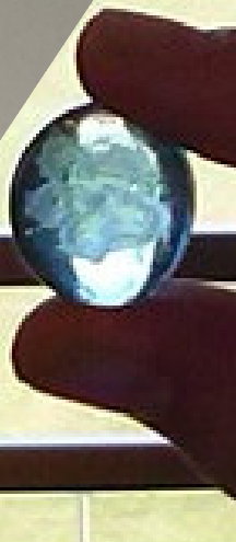
Julius selbst verzierte Gemme – Das Schleifgerät ist zugegebenermaßen ein wenig leichter zu handhaben als vor 2000 Jahren 😊